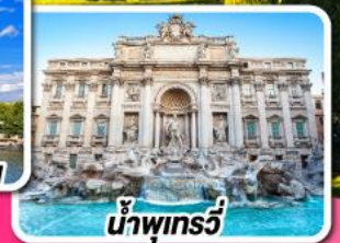
น้ำพุกรวี

28 ม.ค.-06 ก.พ. 68 06-15 มี.ค. 68 09-18 เม.ย. 68