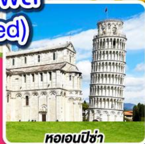
หออนปิซ่า