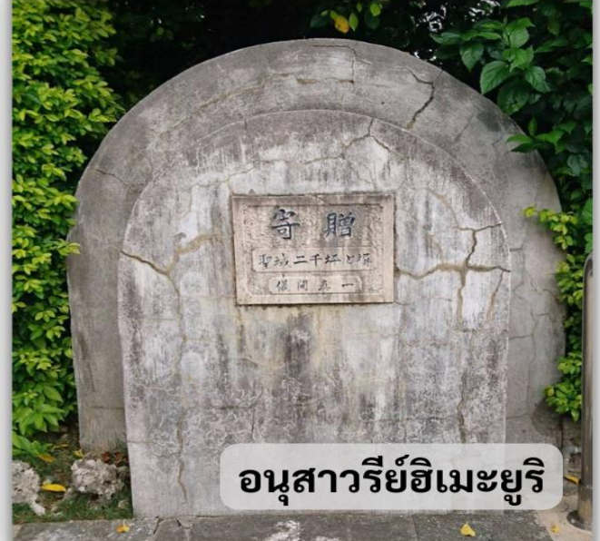
อนุสาวรีย์ฮิเมะยูริ

อนุสาวรีย์ฮิเมะยูริ ที่สร้างขึ้นเพื่อรำลึกถึงดวงวิญญาณของเหล่านักเรียนหญิงฮิเมะยูริที่ได้เสียชีวิตในสงครามโอกินาวาในปี 1945 และปี 1989 โดยนักเรียนฮิเมะยูริคือนักเรียนหญิงมัธยมปลายและครูที่ได้เข้าไปมีส่วนร่วมในสงครามโอกินาวาเพื่อดูแลผู้ป่วยขนาน้ำและอาหารให้กับกองทัพก่อนที่จะเสียชีวิตลงจากลูกหลงของการสู้รบที่รุนแรงขึ้น