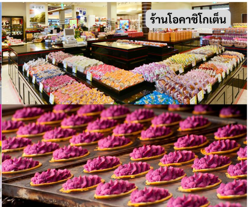
ร้านโอคาชิโกเต็น

อิสระช้อปปิ้ง ร้านโอคาชิโกเต็น ร้านขนมขึ้นชื่อของเมืองโอกินาวา อาทิเช่น ทาร์ตมันม่วง ที่มีคุณภาพและเป็นที่ยอมรับ คุณสามารเลือกของที่ระลึกต่างๆ และขนมขึ้นชื่อของโอกินาวาได้ที่นี้ เย็น เดินทางกลับสู่ที่พัก โรงแรม HOTEL SUN OKINAWA หรือเทียบเท่า