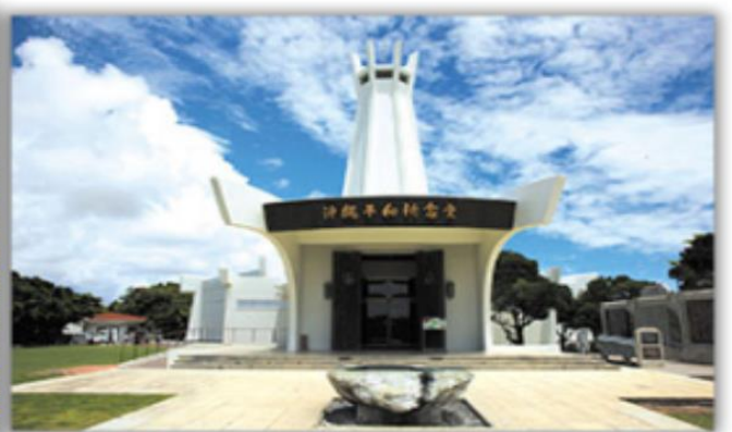
สวนสันติภาพ

สวนสันติภาพ อนุสาวรีย์ที่เป็นสัญลักษณ์ของการสันติภาพ ซึ่งตั้งอยู่ท่ามกลาง สวนสาธารณะ และอุทยาน สวนมีทางล้อมรอบโดยเสาอุปราชที่ออกแบบมาเป็นสัญลักษณ์ ของความสันติภาพ เป็นอนุสรณ์เพื่อรำลึกถึงผู้ที่เสียชีวิตในสมรภูมิที่โอกินาวาในช่วงสงครามโลกครั้งที่ 2 ซึ่งเป็นหนึ่งในสมรภูมิที่นองเลือดที่สุดในสงคราม